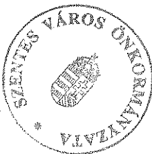
Szurbik Imre Szentes Város Polgármestere